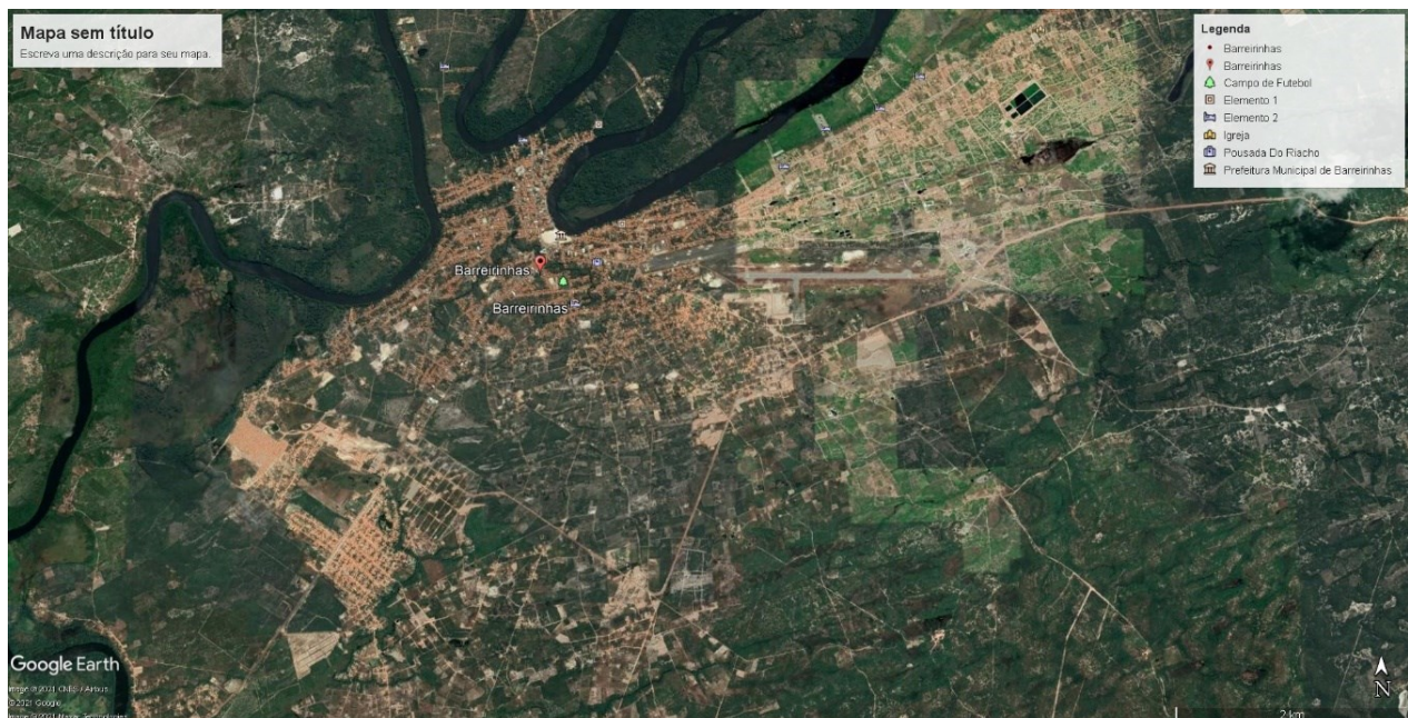
IMAGEM 1: Mapa da Cidade de Barreirinhas – MA

8.1. A CONTRATADA deverá transportar os resíduos sólidos coletados até o destino final (imagem 2) indicado pela CONTRATANTE, sendo que este local, encontra-se a 29,00 km distância do centro da cidade de Barreirinhas – MA.