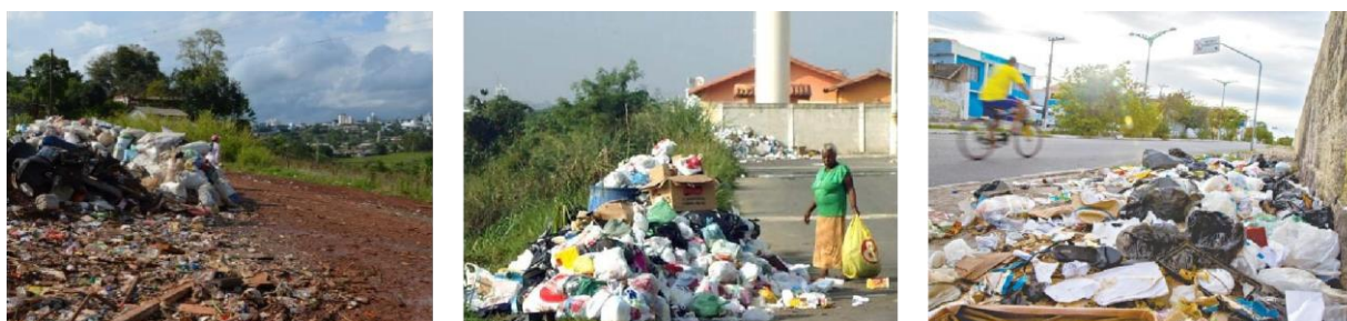
FIGURA 01 – Resíduos sólidos sem acondicionamento

1.3.1. Sistema de Coleta e Transporte Misto: os resíduos são coletados nos locais onde são gerados e misturados dentro de um veículo transportador para depois seguirem até uma destinação. Este tipo de sistema é normalmente encontrado em municípios e cidades sem planejamento urbano, onde o setor de resíduos se encontra ainda desestruturado, sem legislação específica;