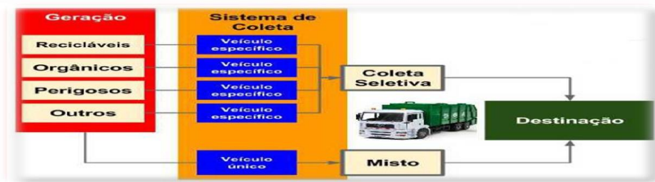
FIGURA 02 – Sistema de coleta e transporte de resíduos sólidos.