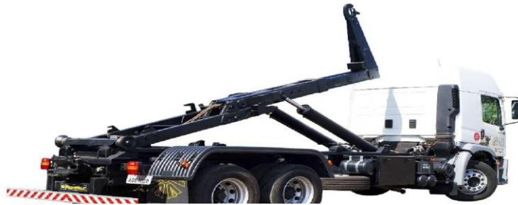
FIGURA 04 – Caminhão Roll On/Roll Off .

Geralmente são veículos de três eixos, com capacidade de tração superior a 10 toneladas, movidos a diesel.