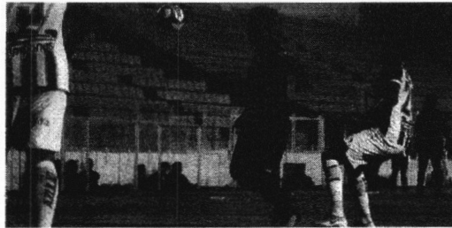
A PRIMEIRA PARTIDA TERMINOU EMPATADA SEM GOLS NO ESTÁDIO NHOZINHO SANTOS