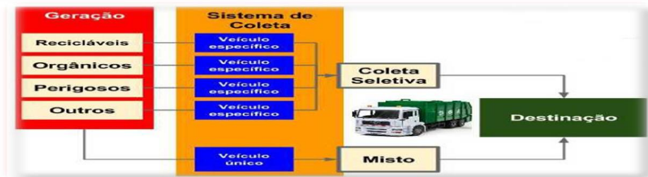
FIGURA 02 – Sistema de coleta e transporte de resíduos sólidos.