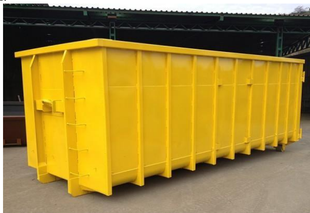
FIGURA 05 – Caçamba Roll On/Roll Off .

As caçambas Roll On/Roll Off (Figura 04) tem capacidade de até 30m 3 , para acondicionamento de diversos tipos de resíduos, as quais podem ser removidas e estacionadas em local desejado. São fabricadas em aço carbono e possuem reforço do tipo “costela” ao longo do comprimento. As portas contam com sistema de reforço anti-empenamento. O chassi base é fabricado em viga “U” laminada, com alta resistência mecânica e mínima deformação, são soldadas por processo MIG/MAG formando um chassi.