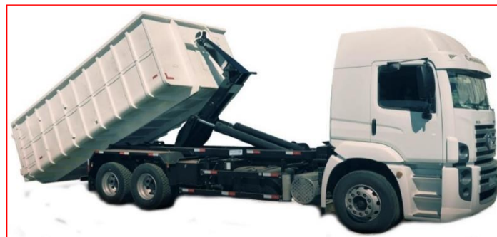
FIGURA 03 – Caminhão Roll On/Roll Off com caçamba