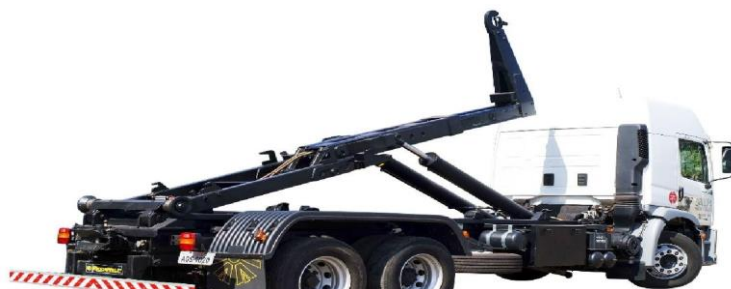
FIGURA 04 – Caminhão Roll On/Roll Off .

Geralmente são veículos de três eixos, com capacidade de tração superior a 10 toneladas, movidos a diesel.