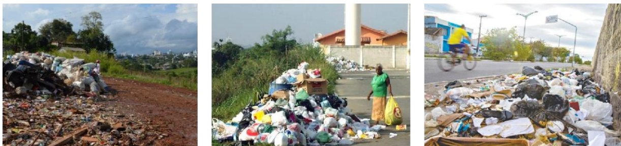
FIGURA 01 – Resíduos sólidos sem acondicionamento

1.3.1. Sistema de Coleta e Transporte Misto: os resíduos são coletados nos locais onde são gerados e misturados dentro de um veículo transportador para depois seguirem até uma destinação. Este tipo de sistema é normalmente encontrado em municípios e cidades sem planejamento urbano, onde o setor de resíduos se encontra ainda desestruturado, sem legislação específica;